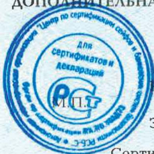
Схема сертификации - 1с